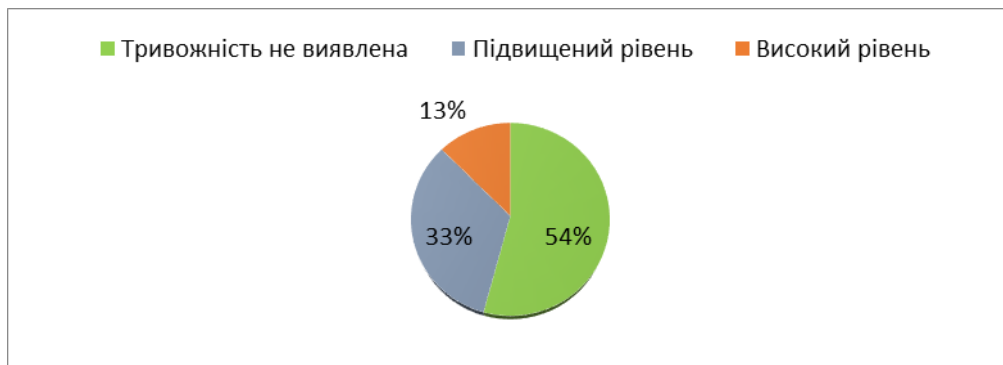
Рис 1. Рівень тривожності за методикою «Неіснуюча тварина»

На підставі аналізу отриманих малюнків можна зробити такі висновки: незначне підвищення рівня тривожності спостерігається у 9 із 24 учнів, що складає 33,3% від усього класу. Явно високий рівень тривожності показали малюнки 3-х учнів, що становить 12,5%. На рис. 1 представлені результати методики усього класу.