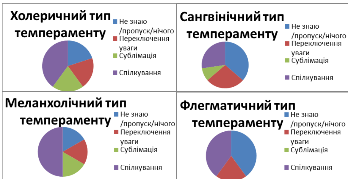
Рис. 3. Розподіл категорій у досліджуваній групі респондентів на речення «Щоб подолати своє почуття самотності, Я ...»

Встановлено, що у респондентів з флегматичним типом темпераменту переважає бачення самотності як ресурсу. Ми пов'язуємо це з тим, що ці респонденти вміють використовувати самотність задля досягнення гармонії з собою, для відпочинку, як можливість все обміркувати. Також, ми пов'язуємо це з тим, що респонденти з цим типом темпераменту інтровертовані (направлені на себе), їм властиві спокій, витримка, байдужість до оточуючих.