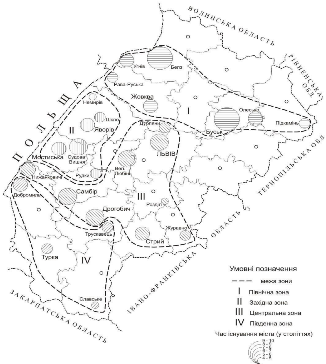
Рис. 2. Зонування Львівщини за характером залежності кількості історико-архітектурних пам'яток від кількості міського населення

Західна зона розташовується на південь від Розточчя і в її міських поселеннях (Яворів, Мостиська, Судова Вишня, Шкло, Немирів, Рудки) спостерігається залежність: