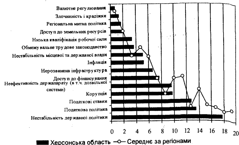
Рис. 1. Фактори для ведення підприємницької діяльності у 2013 році

При цьому, здатність до впровадження інновацій залежить від прибутковості діяльності власне суб'єктів господарювання, джерел інвестицій, фінансових ресурсів та їх доступності. Необхідно наголосити на зростанні ціни на якісну сировину, енергоресурси, а також збільшення видатків на заробітну плату та інших витрат [6]. Це спонукає до оптимального використання необхідних ресурсів та енергосилов. Подолання діалектичного протиріччя між впровадженням інновацій та ефектом від них є рушійною силою зростання конкурентоспроможності. Велике значення має удосконалення систем менеджменту, маркетингу, реструктуризація та капіталізація галузей, формування кластерів, корпоративних форм організації виробництва.