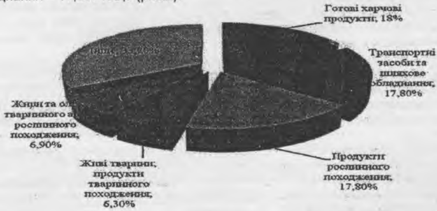
Рис. 2. Основна товарна структура експорту [8]

У структурі експорту регіону найбільша частка припадає на поставки готових харчових продуктів – 18% від загального обсягу, продуктів рослинного походження – 17,8%, транспортних засобів та шляхового обладнання – 17,8% тощо (рис.2).