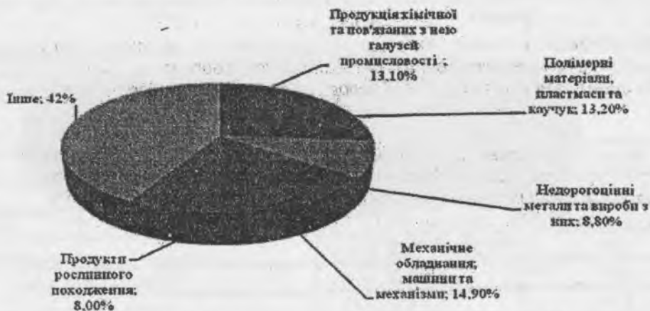
Рис. 4. Основна товарна структура імпорту [8]

У структурі імпорту регіону найбільша частка припадає на поставки механічного обладнання – 14,9% від загального обсягу, полімерних матеріалів пластмаси та каучуку – 13,2%, продукції хімічної та пов'язаних з нею галузей промисловості – 13,1%, недорогоцінних металів та виробів з них – 8,8%, продуктів рослинного походження – 8% тощо (рис.4).