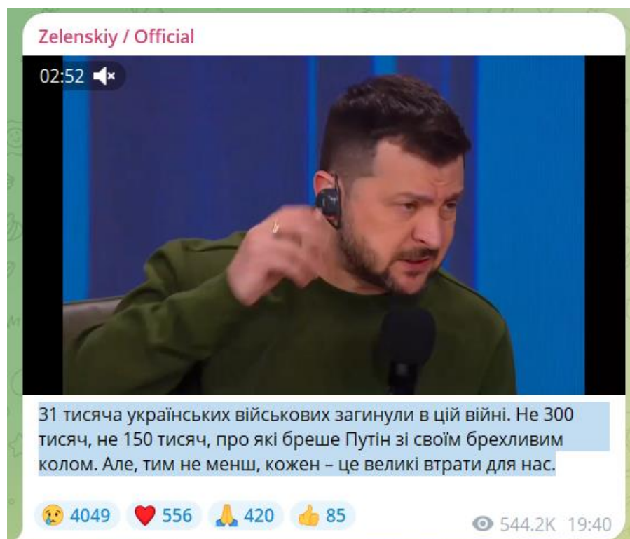
Рис. 2.2 Повідомлення у Telegram каналі президента України Володимира Зеленського

1. Спростування інформації про кількість загиблих українських солдатів, яку активно просувають російські пропагандисти: «31 тисяча українських військових загинули в цій війні. Не 300 тисяч, не 150 тисяч, про які бреше Путін зі своїм брехливим колом. Але, тим не менш, кожен – це великі втрати для нас» [3].