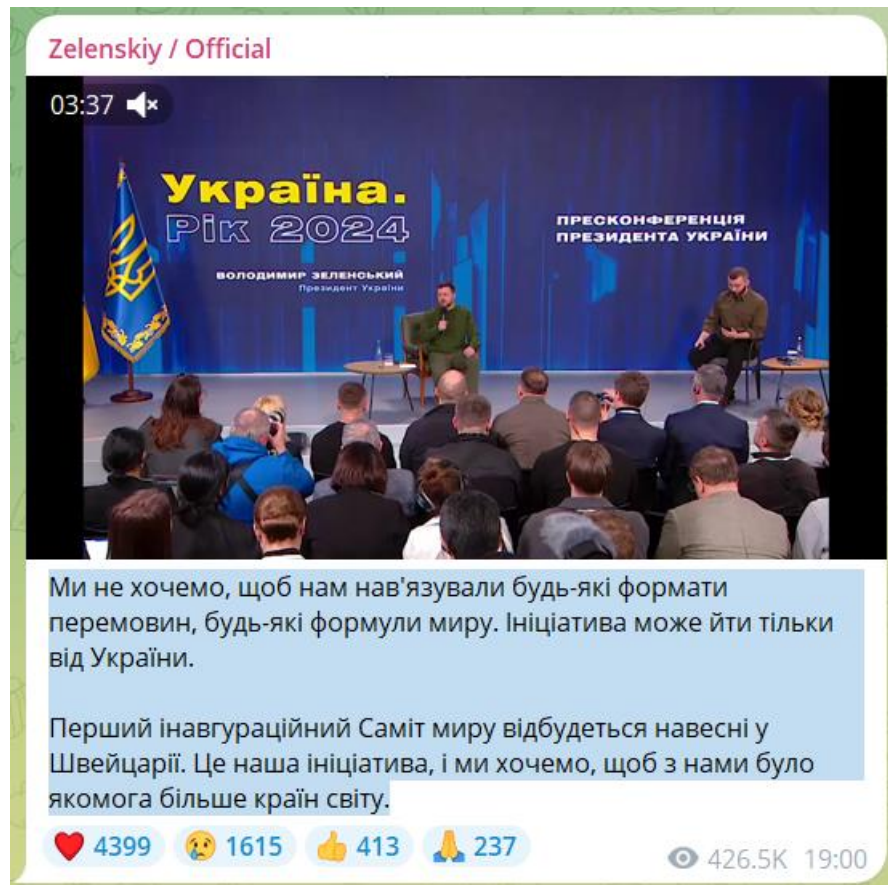
Рис. 2.2 Повідомлення у Telegram каналі президента України Володимира Зеленського

Саміт миру відбудеться навесні у Швейцарії. Це наша ініціатива, і ми хочемо, щоб з нами було якомога більше країн світу» [3].