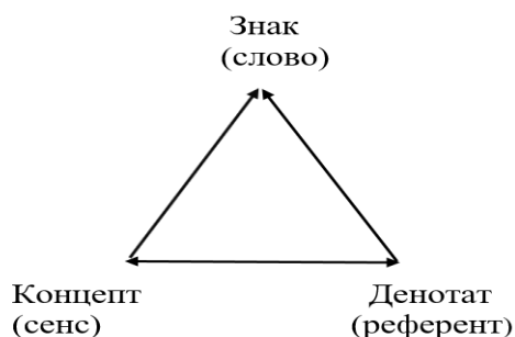
Рис.1. Семантичний трикутник Фреге

У нашій роботі ми розглядаємо сенсорну алалію виключно в мовному підході, в якому порушення розуміння мовлення пов'язане із труднощами співвіднесення смислової та звукової оболонки слова. Сенсорна алалія згідно з мовним підходом – це порушення розвитку імпресивного мовлення через складнощі співвіднесення звукової оболонки слова або її частин (морфем) з їх значенням [1]. Щоб краще розуміти, як відбувається надання сенсу слову, розглянемо семантичний трикутник Фреге (рис.1.). На вершині трикутника знаходиться звукова оболонка, або фонетичне слово. Це набір звуків у певній послідовності, яким надається сенс.