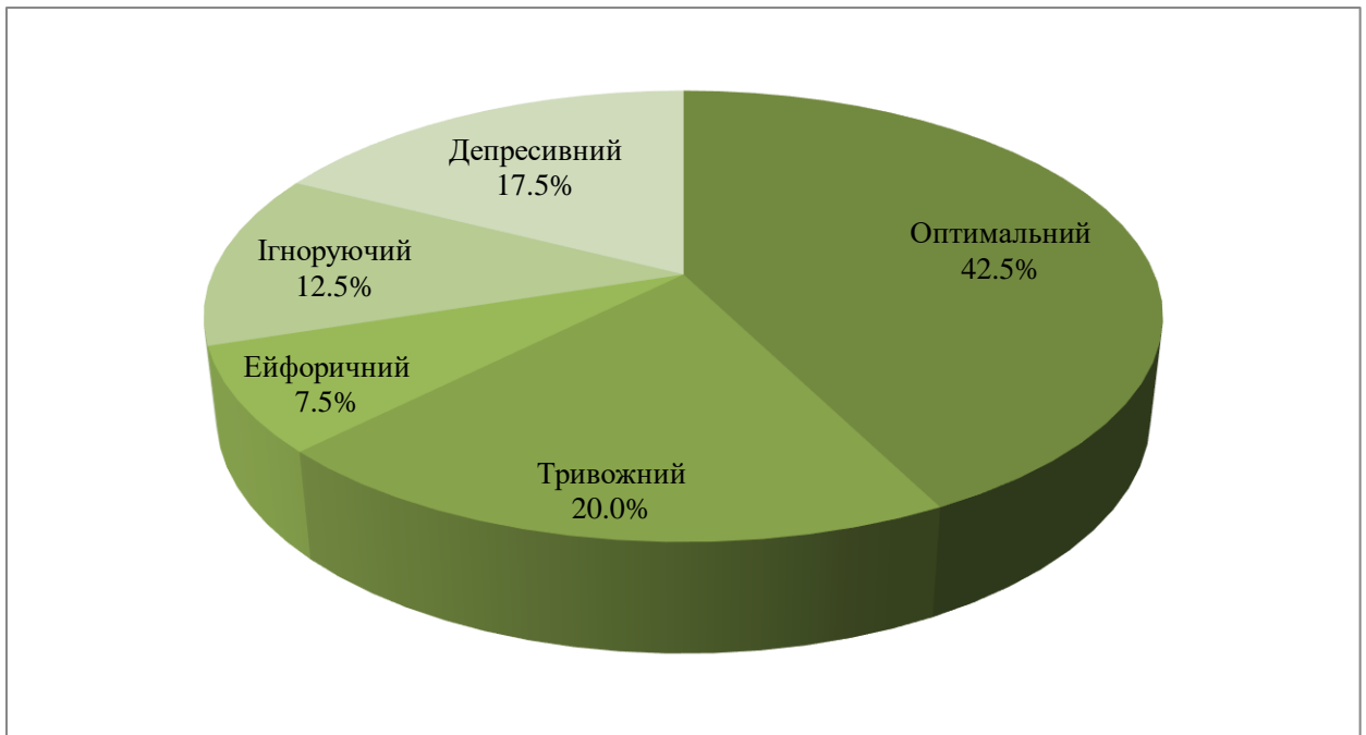
Рис. 2.1. Типи психологічного компоненту гестаційної домінанти

Аналізуючи отримані показники, ми можемо сказати, що у 42,5% спостерігається оптимальний тип ПКГД, що свідчить про природне протікання і ставлення до вагітності, що визначається відповідальним відношенням, дотримання рекомендацій лікарів, ведення здорового способу життя.