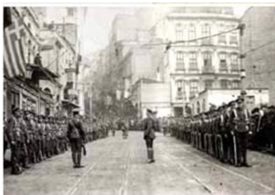
Британські війська зі складу окупаційних формувань Антанти на вулицях Стамбула. Січень 1919 року.