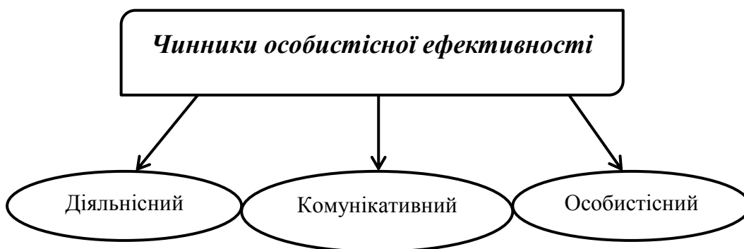
Рис.1 – Категорії особистісної ефективності за А. Бандурою.

Якщо брати до уваги професійні чинники особистісної ефективності то їх А. Бандура розподілив на: діяльнісний (результативний), комунікативний та особистісний чинник самоефективності (рис. 1).