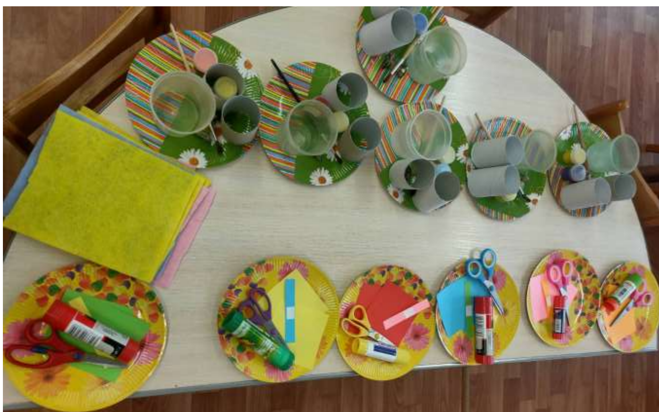
Фото колективної роботи «Метелик на весняному лузі».