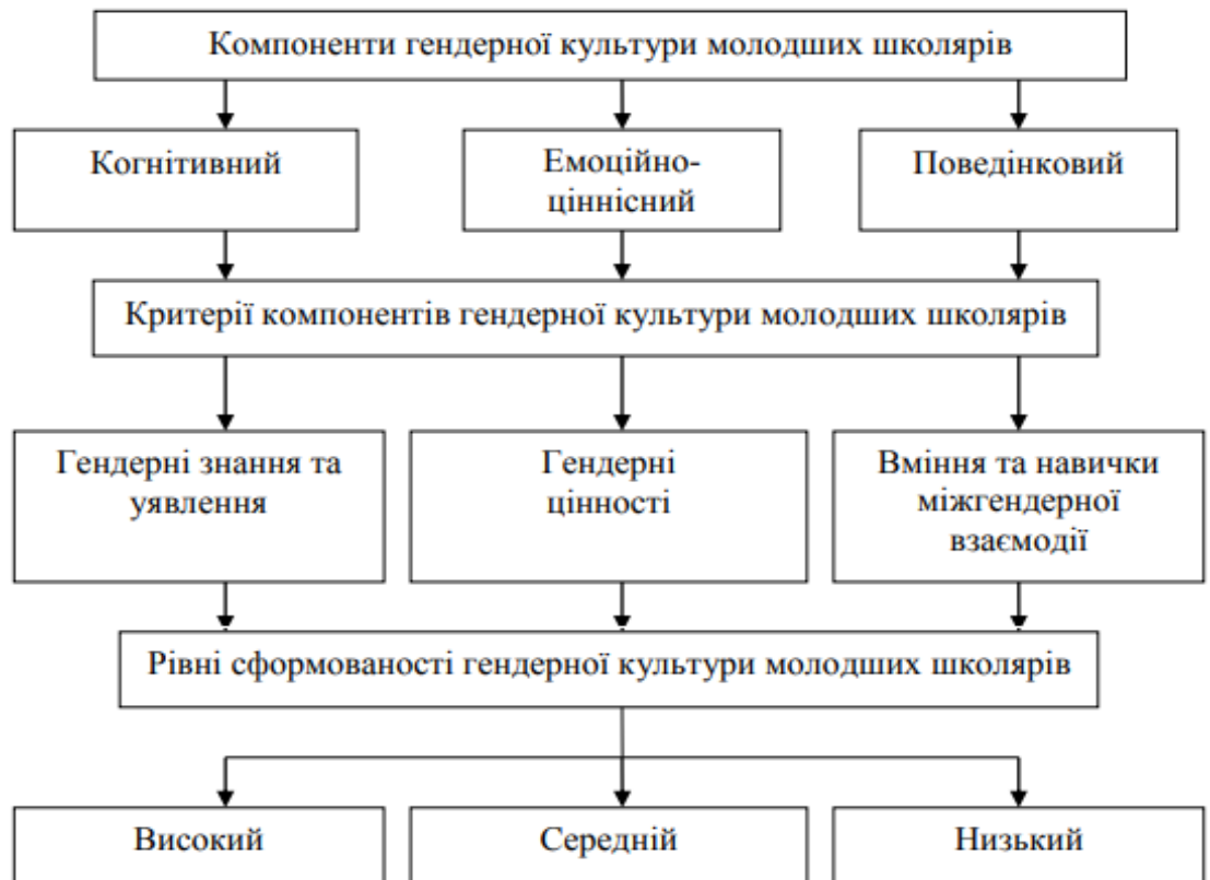
Рис. 1 Структура гендерної культури молодших школярів

Схематичне зображення структури гендерної культури молодших школярів відображено на рис.1.