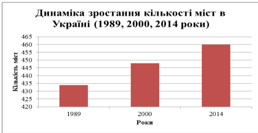
Рис.1. Динаміка зростання кількості міст в Україні (1989, 2000, 2014 роки)