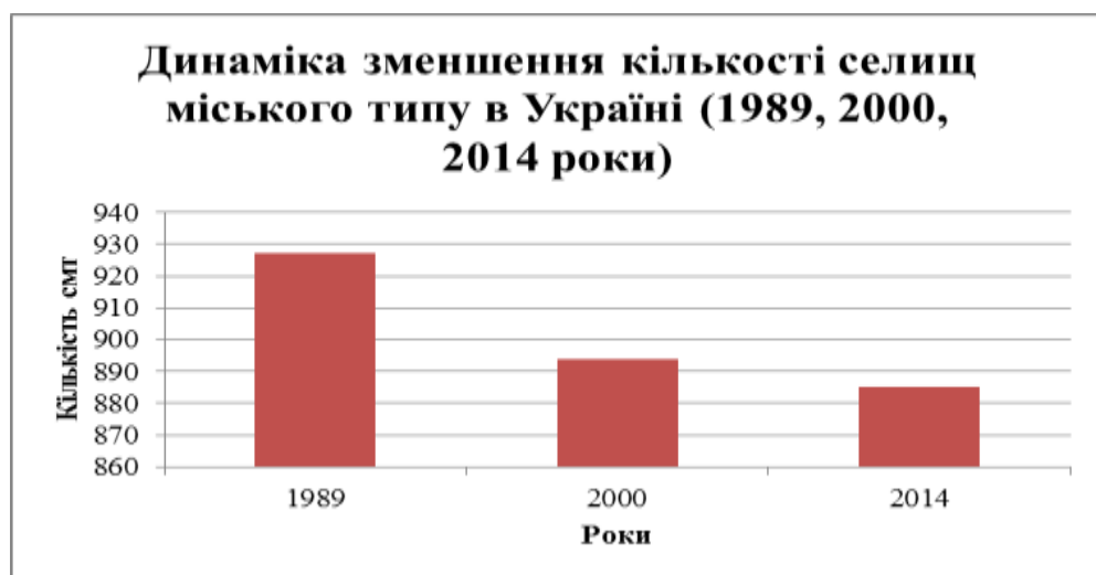
Рис.2. Динаміка зменшення кількості селищ міського типу в Україні

Важливо відмітити, що у динаміці числа селищ міського типу – міських поселень, які за функціональним призначенням у загальній системі адміністративно-територіального устрою України посідають проміжне місце між сільськими населеними пунктами і містами, але в обліку населення відносяться до міського – ми бачимо зовсім протилежну картину. З роками кількість селищ міського типу зменшувалась за рахунок отримання статусу міста даних поселень і переходу їх на новий рівень, що в свою чергу також свідчить про зростання рівня урбанізації (рис.2).