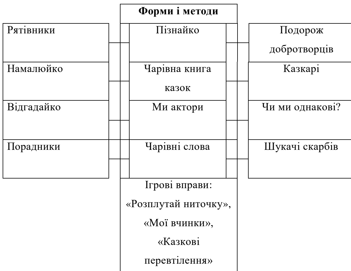
Рисунок 2.3. Форми та методи формування у дошкільників людських цінностей

Різні форми , методи та засоби сучасна педагогіка пропонує вихователю у його професійній діяльності під час формування у дошкільників людських цінностей. Велике значення у цій роботі відіграє народознавство. Тому робота з формування у дошкільників людських цінностей була побудована, спираючись на такі форми і методи.