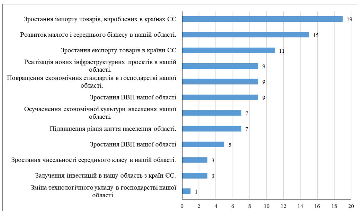
Рис. 3. Розподіл відповідей респондентів на питання: «Які переваги економічної євроінтеграції нашого регіону тобі відомі?»