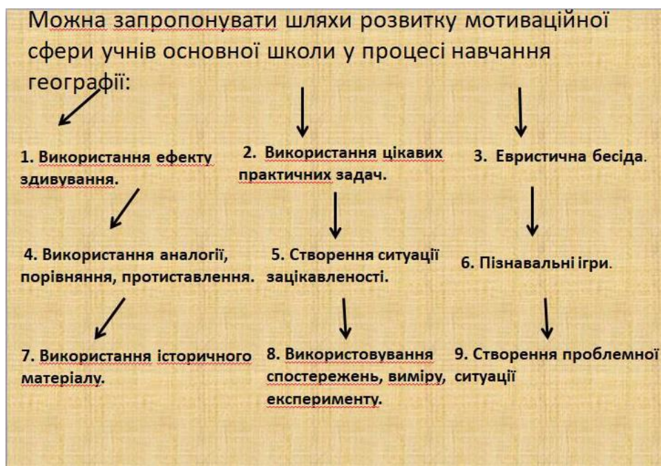
Рис. 5. Методичні рекомендації для розвитку мотиваційної сфери учнів

Для вивчення теми доцільно використати методичні основи проблемного навчання географії учнів основної школи.