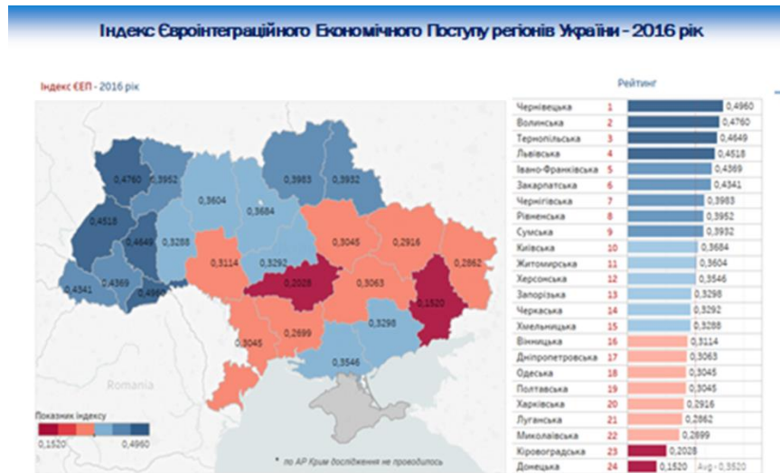
Рис. 1. Індекс євроінтеграційного поступу регіонів України

На завершальному етапі розрахунку індексу євроінтеграційного поступу регіонів України було використано картографічний метод і складено карту України, де регіони зафарбовані в різні кольори, відповідно значенню індексу (див. рис. 1-2). [29].