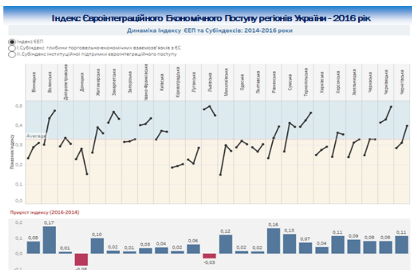
Рис. 2. Індекс євроінтеграційного поступу регіонів України. Динаміка індексу 2014-2016 рр.

Резюме: У 2016 році Херсонська область зайняла 12-те місце у загальнонаціональному рейтингу, за два роки перемістившись на 5 позицій вгору. Перебування області в середині загальноукраїнського рейтингу забезпечують здебільшого показники інституційної підтримки євроінтеграційного поступу.