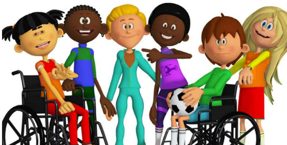
Рис 2.1. Підбірка мультфільмів про толерантність

https://www.youtube.com/watch?v=egwCCe_Zlgl