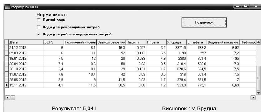
Рис. 2 – Програмна форма «Розрахунок модифікованого ІЗВ»

Приклад автоматичної оцінки якості води за модифікованим індексом забруднення (ІЗВ) для пониззя р. Інгулець за 2012 р. наведено на рисунку 2.